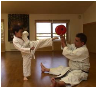
Cours KarateKid (4 à 6 ans)