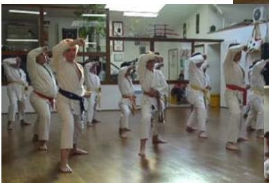
Cours enfants plus de 10 ans