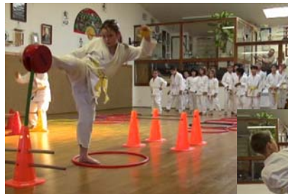
Cours enfants 6 à 10 ans